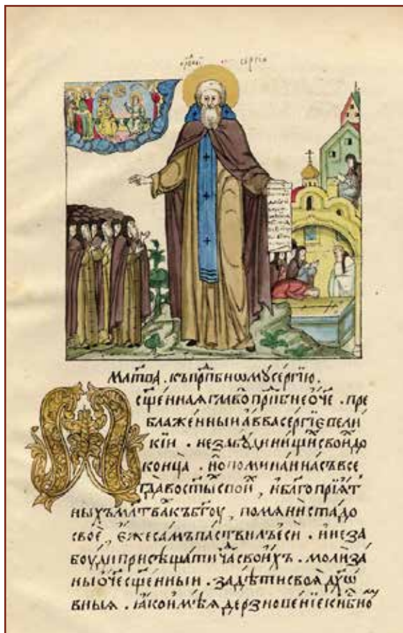
Молитва прп. Сергию из «Лицевого Жития»

Святой не искал игуменства, но согласился принять это служение только по настоятельным просьбам других монахов, искавших его духовного руководства. Случилось так, что, как повествует агиограф, «ненавидящий добро диавол, не терпя сияния, исходящего от преподобного, видя себя побеждаемым преподобным, вложил некоторым из братии помысел отвергнуть игуменство Сергия». Во время богослужения «сказаны были ... неподобающие слова. Находясь в алтаре, святой их слышал, но ничего не сказал. После окончания вечерни, выйдя из церкви, преподобный не пошел в келлию, но, никем не замеченный, покинул монастырь».