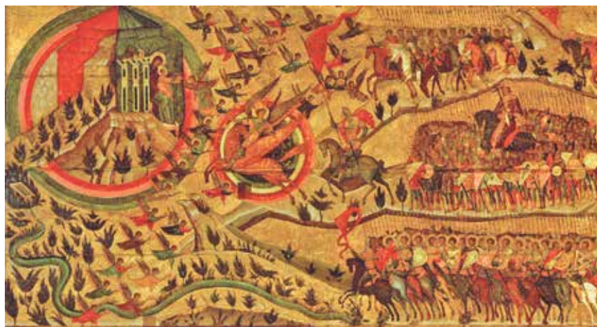
Икона «Церковь воинствующая»

Такое было и с нашей Святой Русью. История нашего