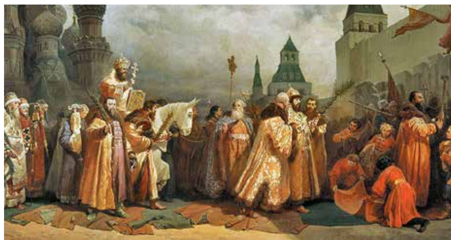
Вербное воскресенье в Москве при царе Алексее Михайловиче. Шествие патриарха на осяти. В. Г. Шварц, 1865 г. ▶

Освященные вербы мы приносим в свои дома, где с благоговением храним, как знак проникающей благодати Божией, до следующего года. Затем ветви сжигают, заменяя на новые. ■