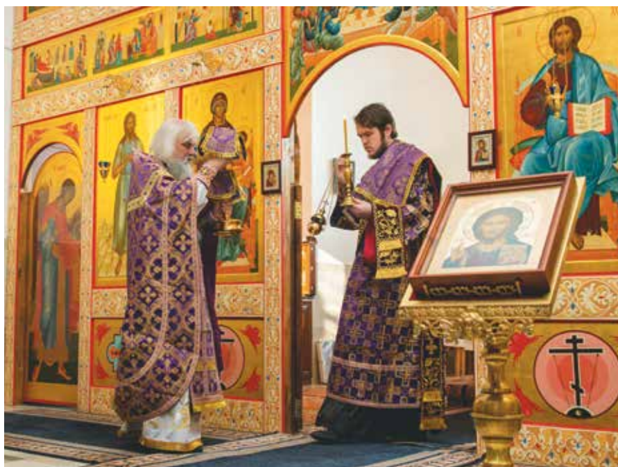
Литургия Преждеосвященных Даров. День памяти первого и второго обретения главы Иоанна Предтечи, 9 марта 2018 года

Чтобы описать поэтику литургических песнопений, придется выйти за пределы словесного текста. Словесная композиция входит в сложное целое храмового богослужения, которое составляют и пространственные движения, и музыкальное интонирование, и свет, и запах. Та или другая модуляция смысла слов зависит и от совсем не словесных