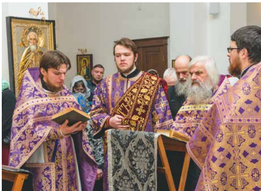
Молебен в день памяти первого и второго обретения главы Иоанна Предтечи, 9 марта 2018 года.

Песнопение «Ныне Силы небесные» отличает удивительная красота фонетических отношений, спокойное движение фразы. ■