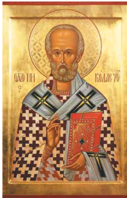
Мощи святителя Николая

Еще при жизни святитель прославился многими чудесами. Спас город Миры от голода — своей горячей молитвой ко Христу. Молился и тем помогал тонущим морякам на судах, выводил из заточения в тюрьмах несправедливо осужденных.