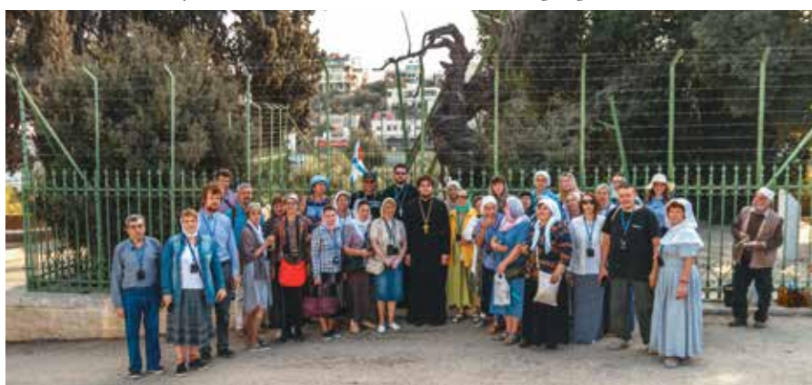
▲ У Мамврийского дуба