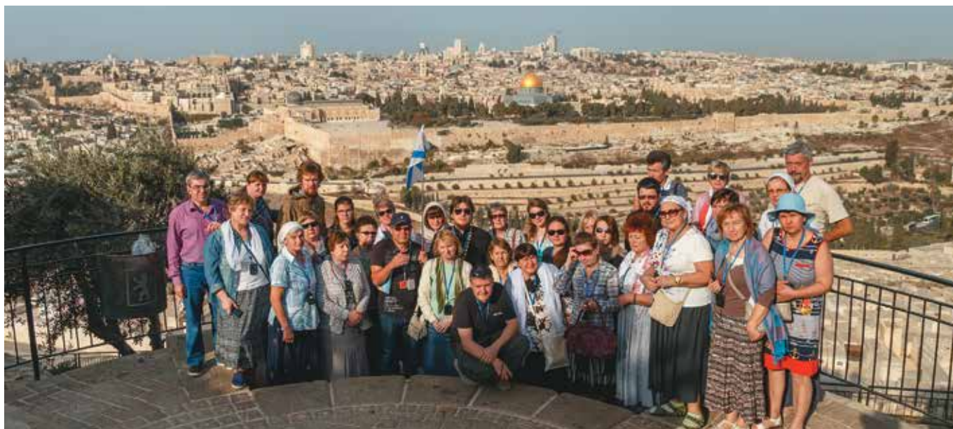
▲ Панорама Иерусалима