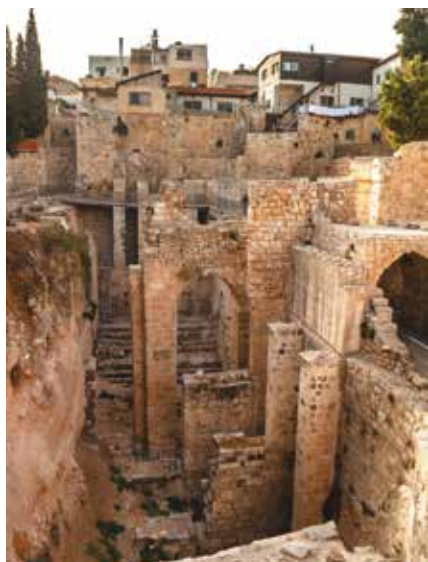
▲ Раскопки Овчей купели