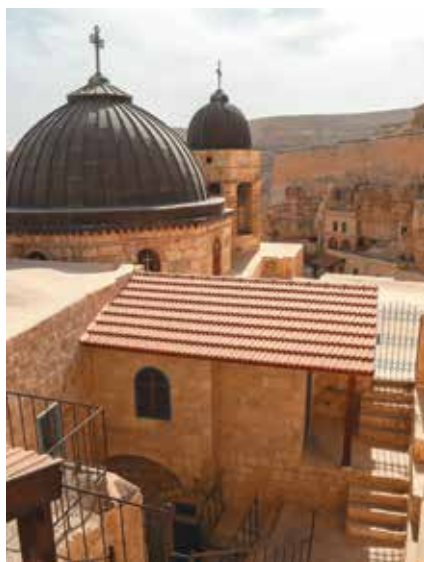
▲ Монастырь прп. Саввы Освященного