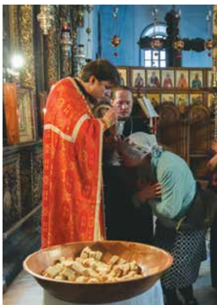
▲ Причастие в храме Рождества Христова

В Вифании, на месте воскресения четверодневного Лазаря, в разное время было целых 5 храмов! Сейчас стоит церковь работы архитектора Антонио