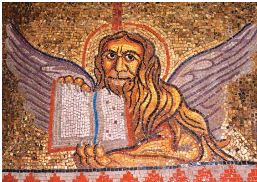
▲ Лев — символ апостола Марка. Фреска из собора святого Марка, Венеция, XI в.

В самом тексте Евангелия каких-либо указаний на личность автора также не содержится, однако древнее церковное предание считает таковым Иоанна Марка, апостола из числа 70, ученика апостола Петра (в Первом послании апостол Пётр называет Марка сыном своим — указание на то, что он был обращён самим Петром). Апостол Марк