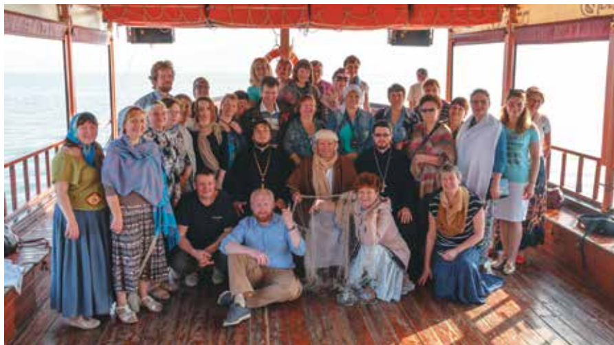
◀ На лодочке на Галилейском море Спас Синайский ▼