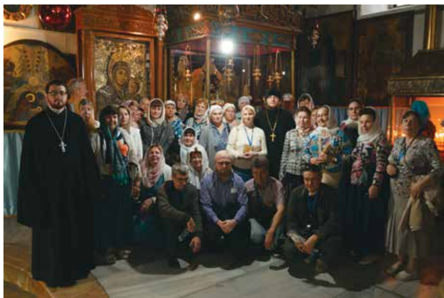
▲ После Причастия. Позади икона Божией Матери «Вифлеемская»