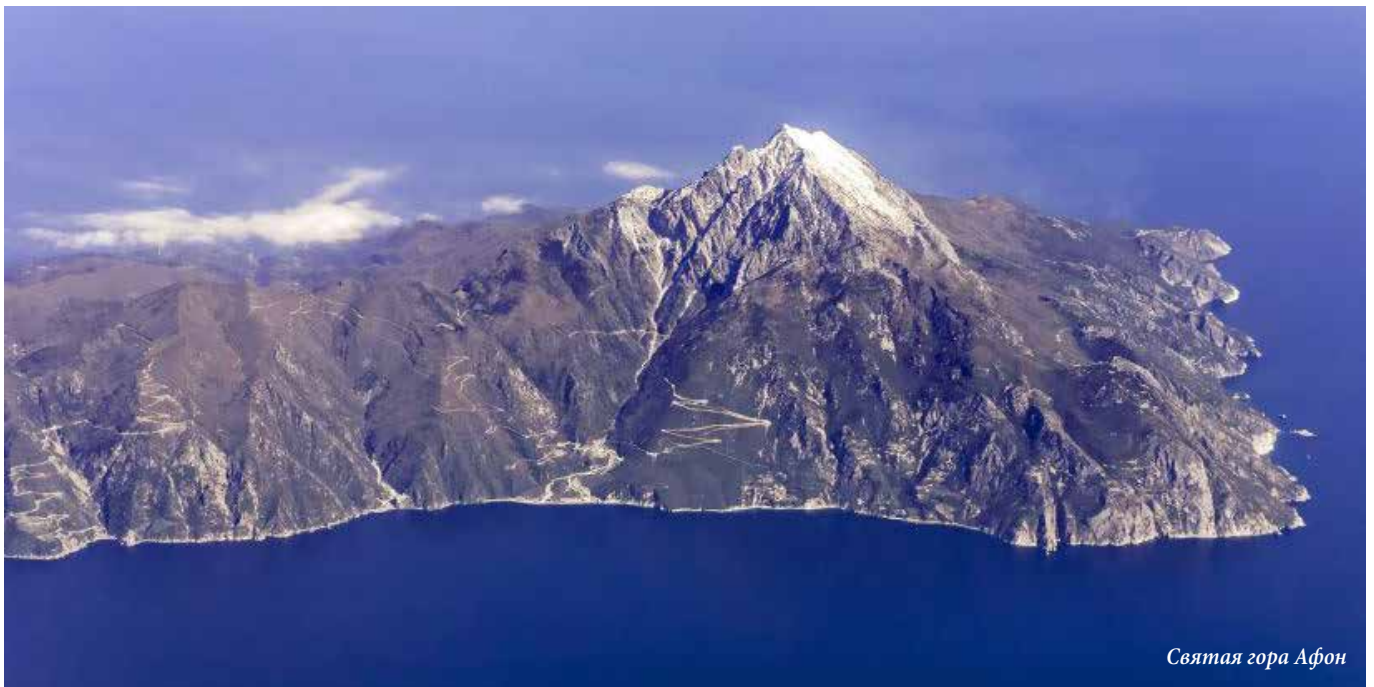
Святая гора Афон