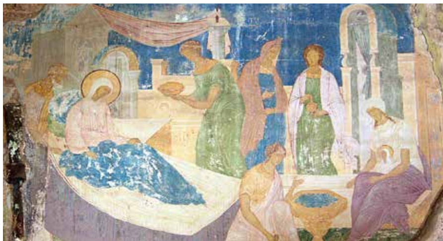
◀ Рождество Пресвятой Богородицы. Фрагмент росписи Ферапонтова монастыря, XVI век.