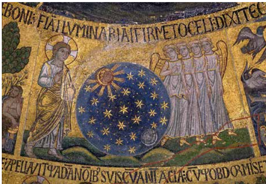
◀ Сотворение светил (Быт. 1, 14-18). Собор Святого Марка, XIII век, Венеция.

и уходит корнями еще в Ветхий Завет: в великих кодексах Моисея ясно говорится о запрещении заниматься всякими видами волшебства под страхом смерти: